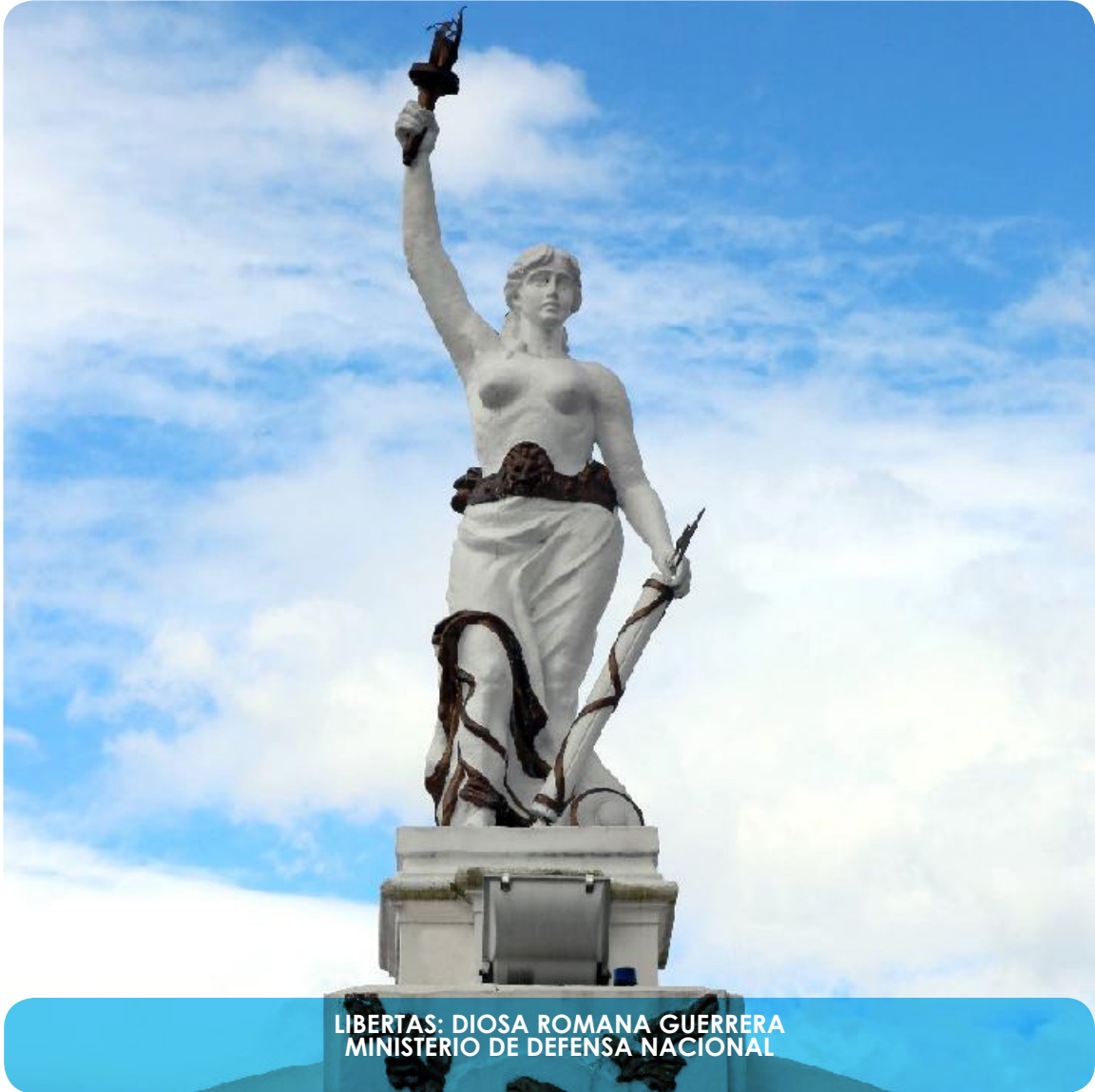
LIBERTAS: DIOSA ROMANA GUERRERA MINISTERIO DE DEFENSA NACIONAL