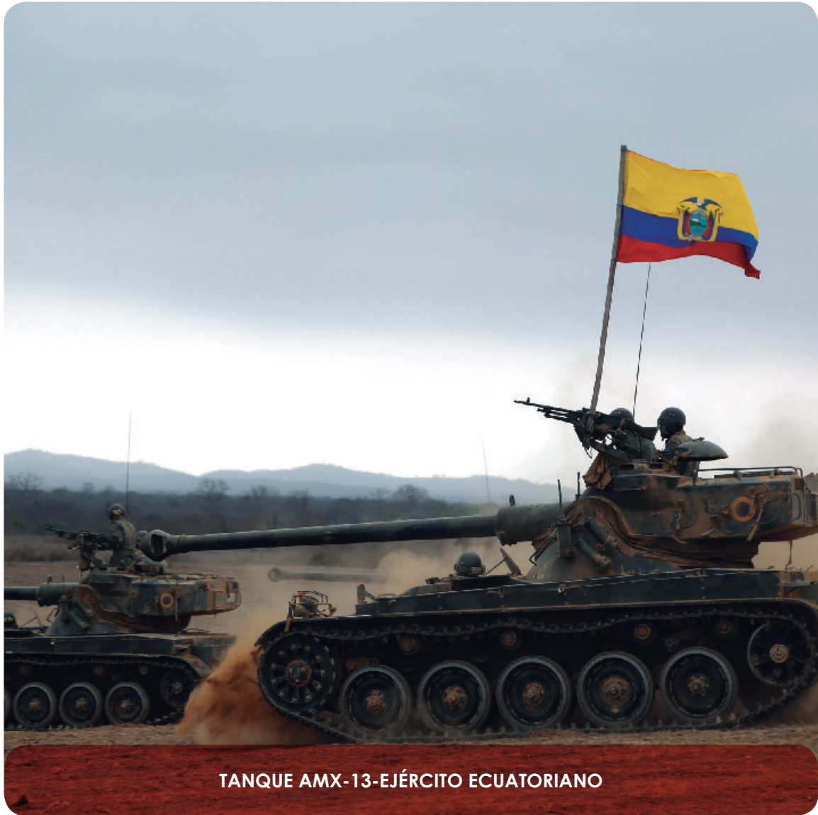
TANQUE AMX-13-EJÉRCITO ECUATORIANO