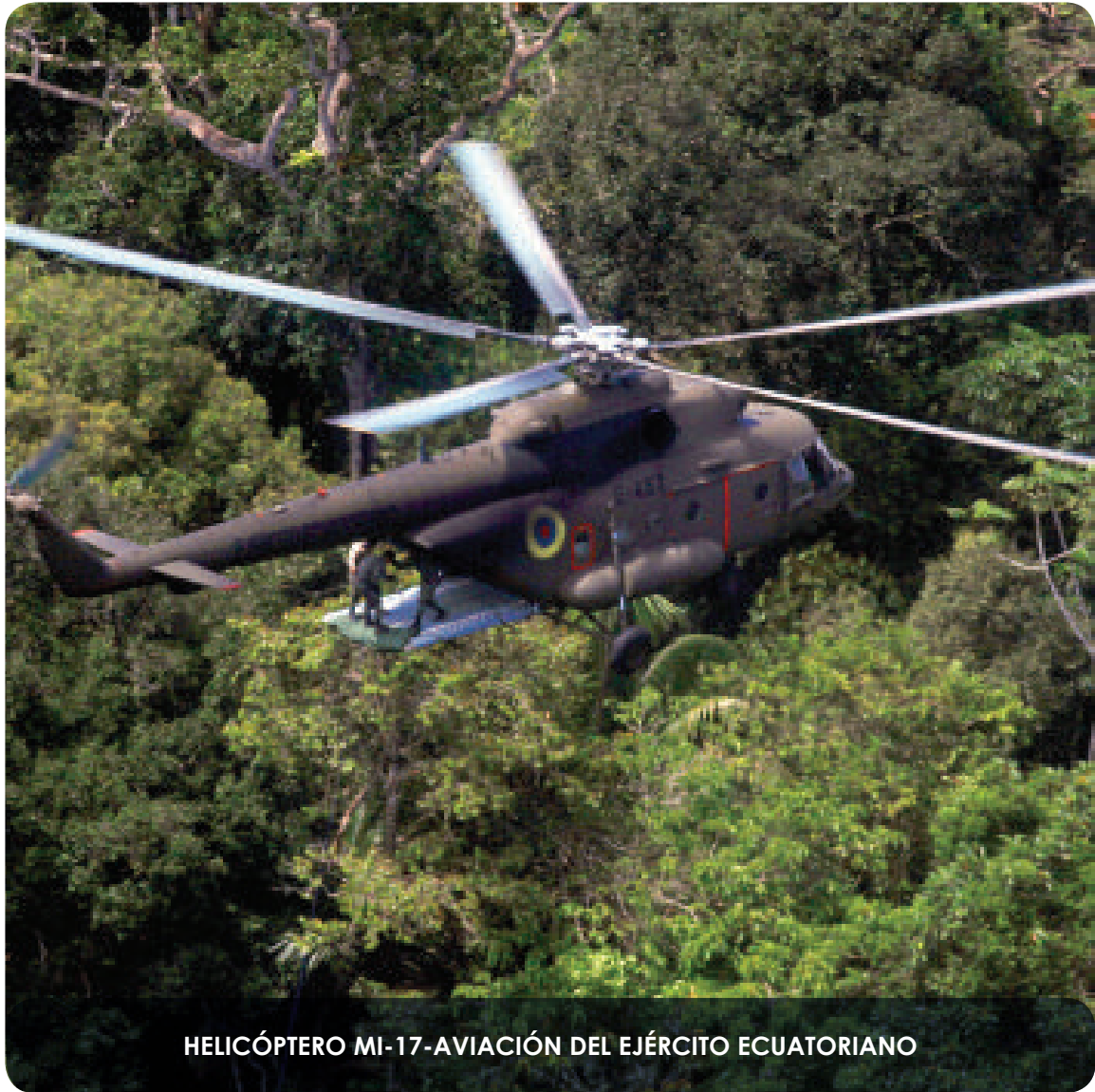
HELICÓPTERO MI-17-AVIACIÓN DEL EJÉRCITO ECUATORIANO