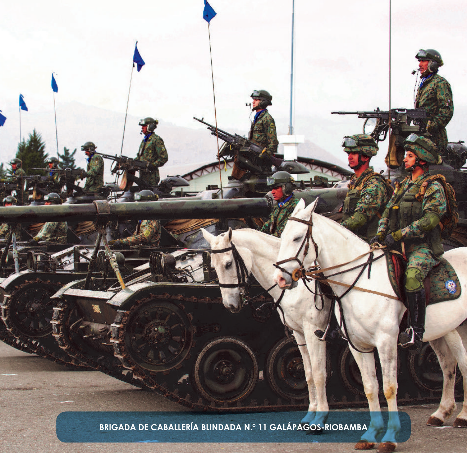
BRIGADA DE CABALLERÍA BLINDADA N.º 11 GALÁPAGOS-RIOBAMBA