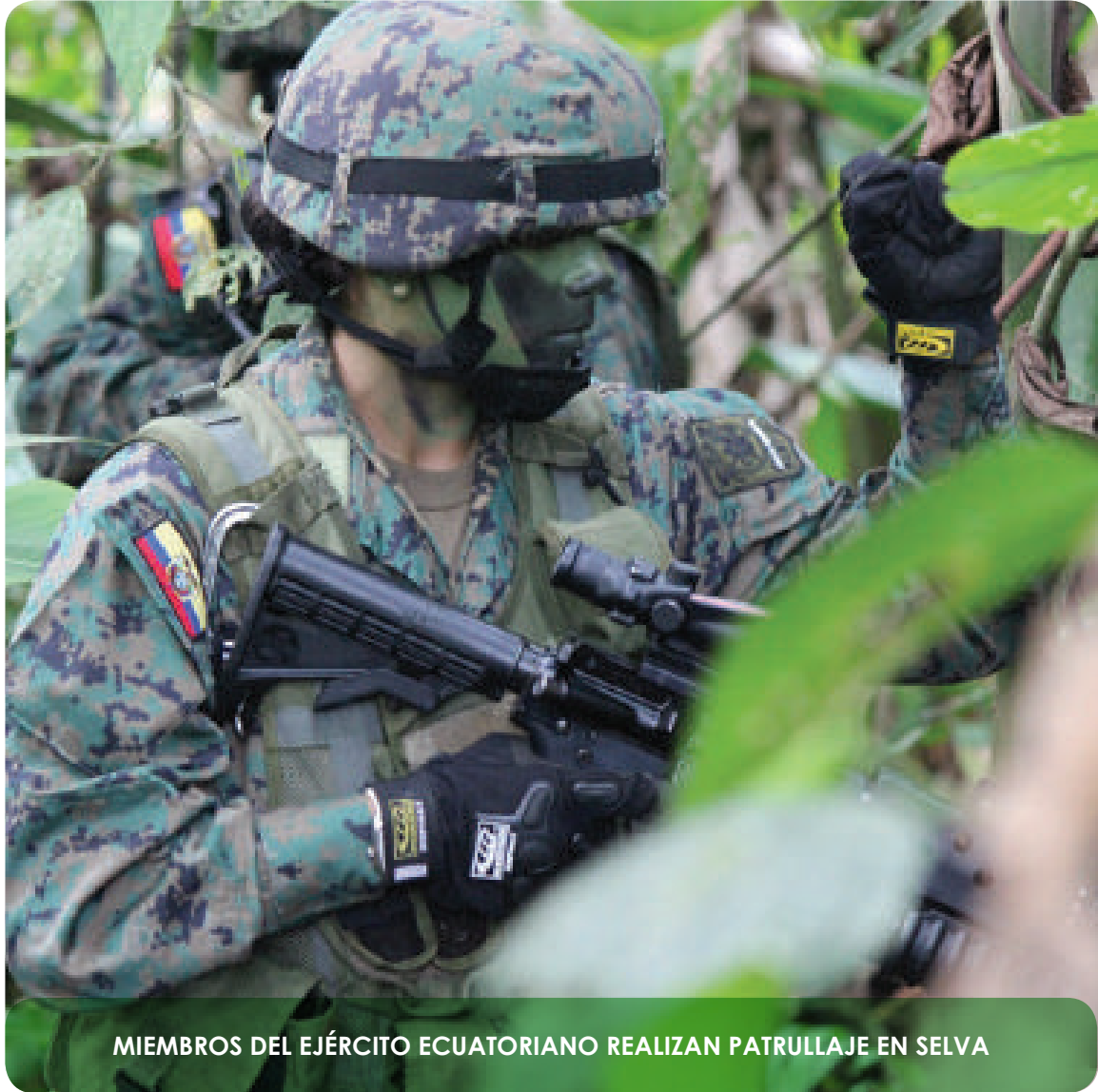
MIEMBROS DEL EJÉRCITO ECUATORIANO REALIZAN PATRULLAJE EN SELVA