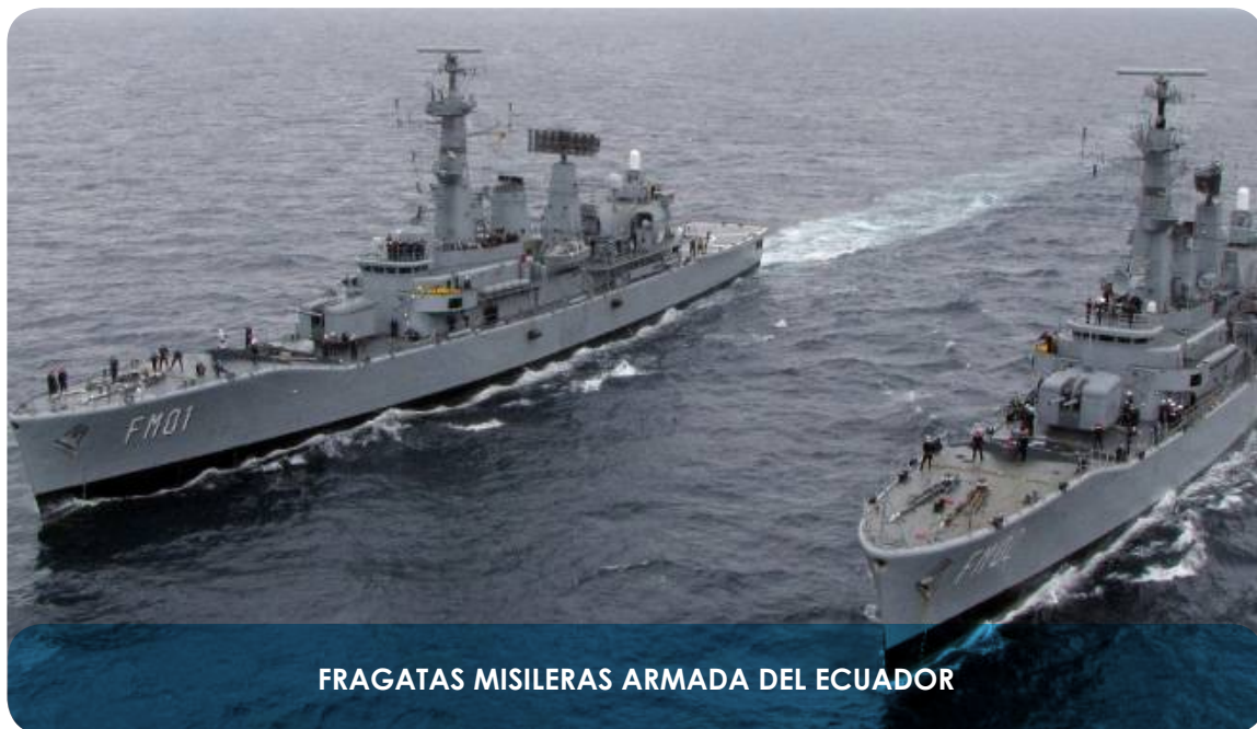
FRAGATAS MISILERAS ARMADA DEL ECUADOR

El presente plan posee una visión sinérgica, articulada, coordinada, sincronizada y proactiva entre los actores responsables de la seguridad, permitiendo reducir las debilidades institucionales y fortalecer las ventajas propias de cada entidad, a fin de que se materialice de manera sistémica y real una situación favorable en términos de seguridad para la sociedad y el Estado, garantizando la protección de sus intereses vitales.