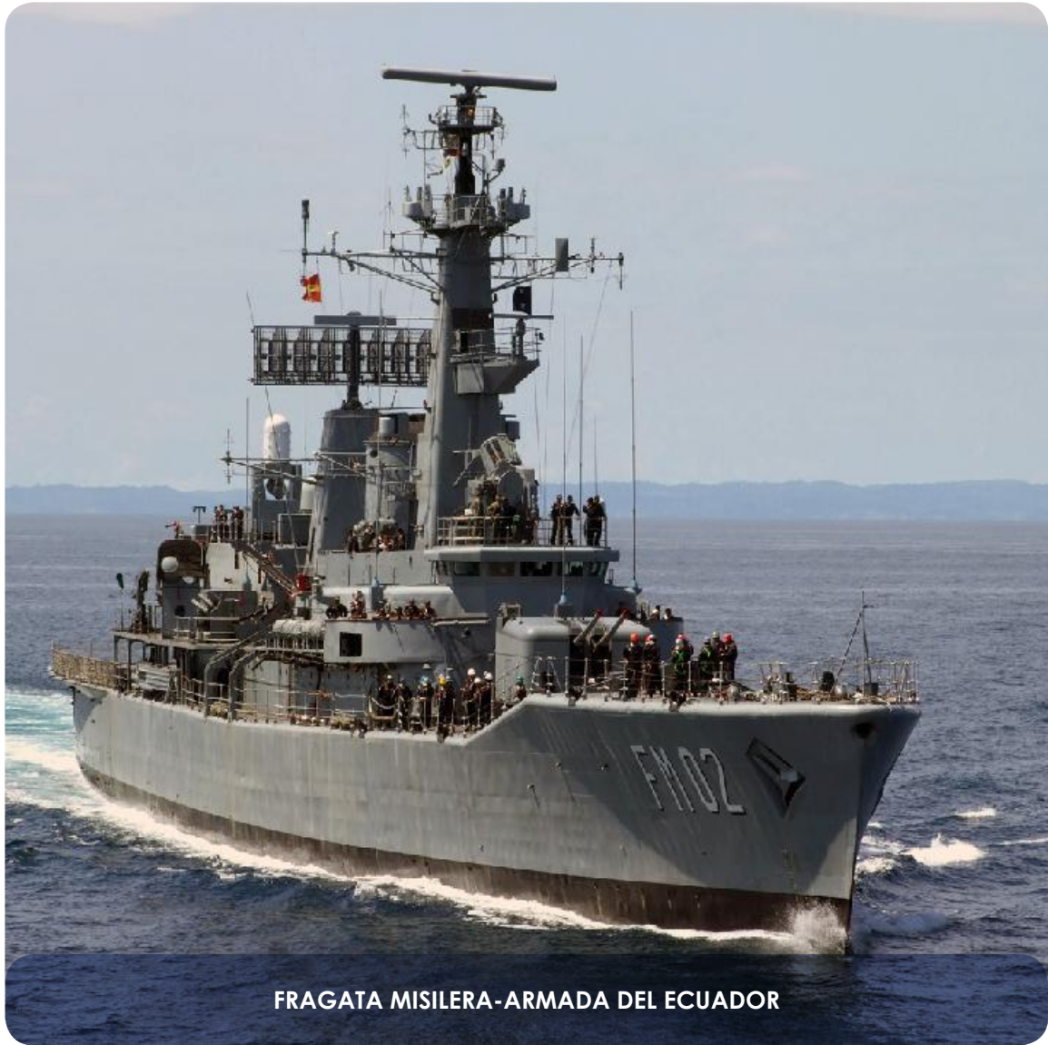
FRAGATA MISILERA-ARMADA DEL ECUADOR