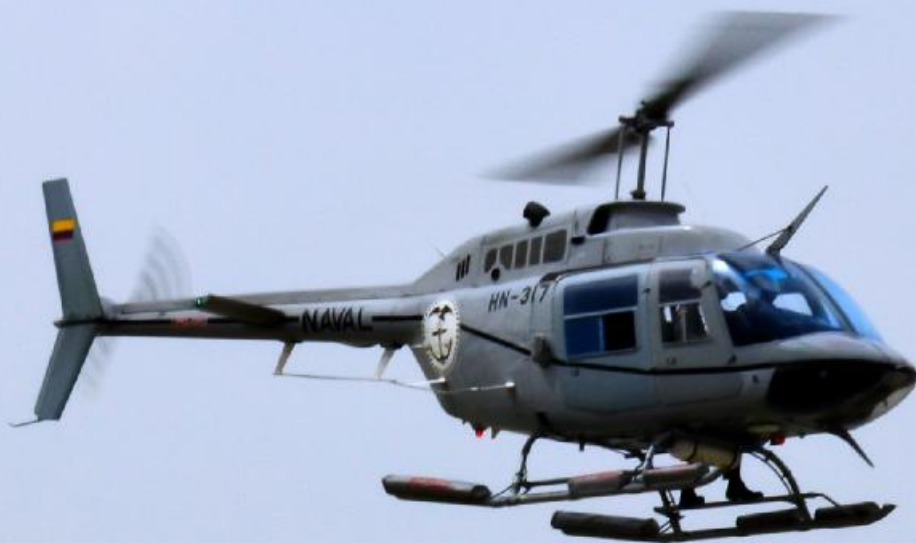
HELICÓPTERO BELL 206 GUARDACOSTAS-ARMADA DEL ECUADOR