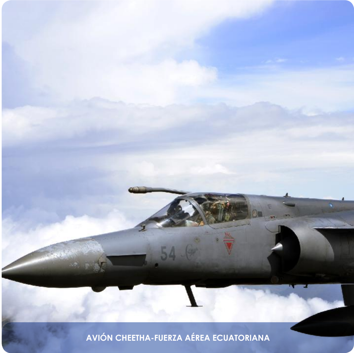
AVIÓN CHEETHA-FUERZA AÉREA ECUATORIANA