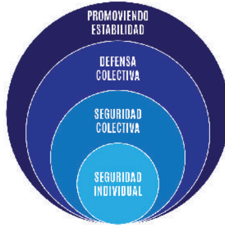
Figura 2. Los anillos de Cohen