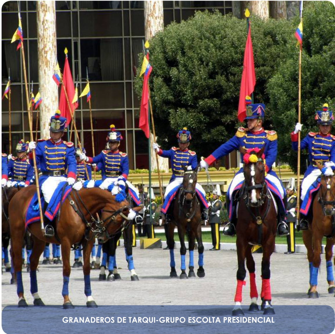
GRANADEROS DE TARQUI-GRUPO ESCOLTA PRESIDENCIAL