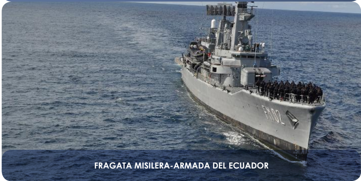
FRAGATA MISILERA-ARMADA DEL ECUADOR