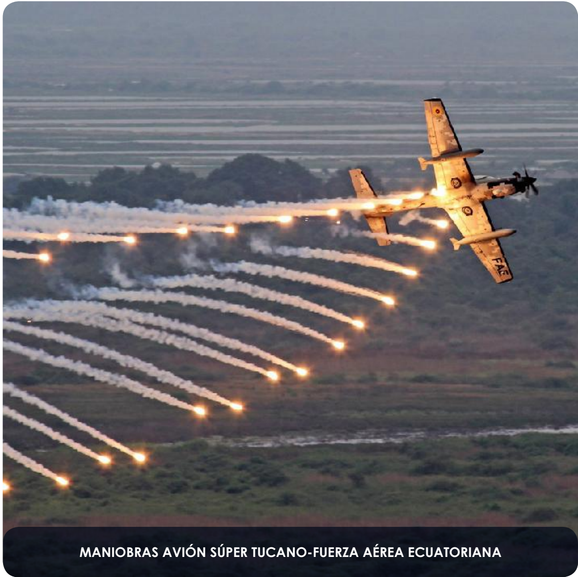
MANIOBRAS AVIÓN SÚPER TUCANO-FUERZA AÉREA ECUATORIANA