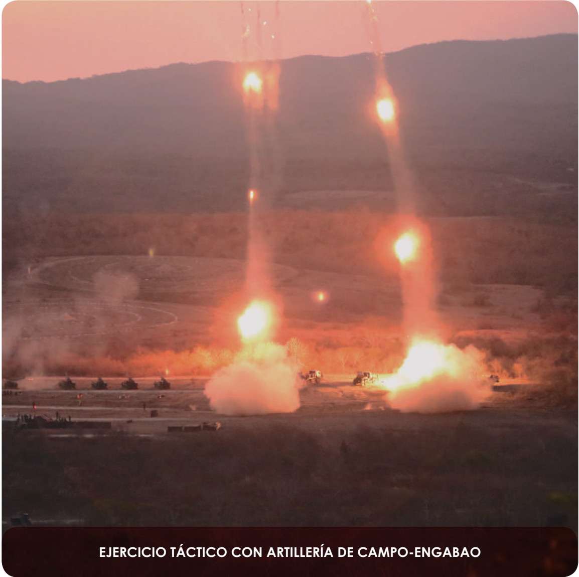
EJERCICIO TÁCTICO CON ARTILLERÍA DE CAMPO-ENGABAO