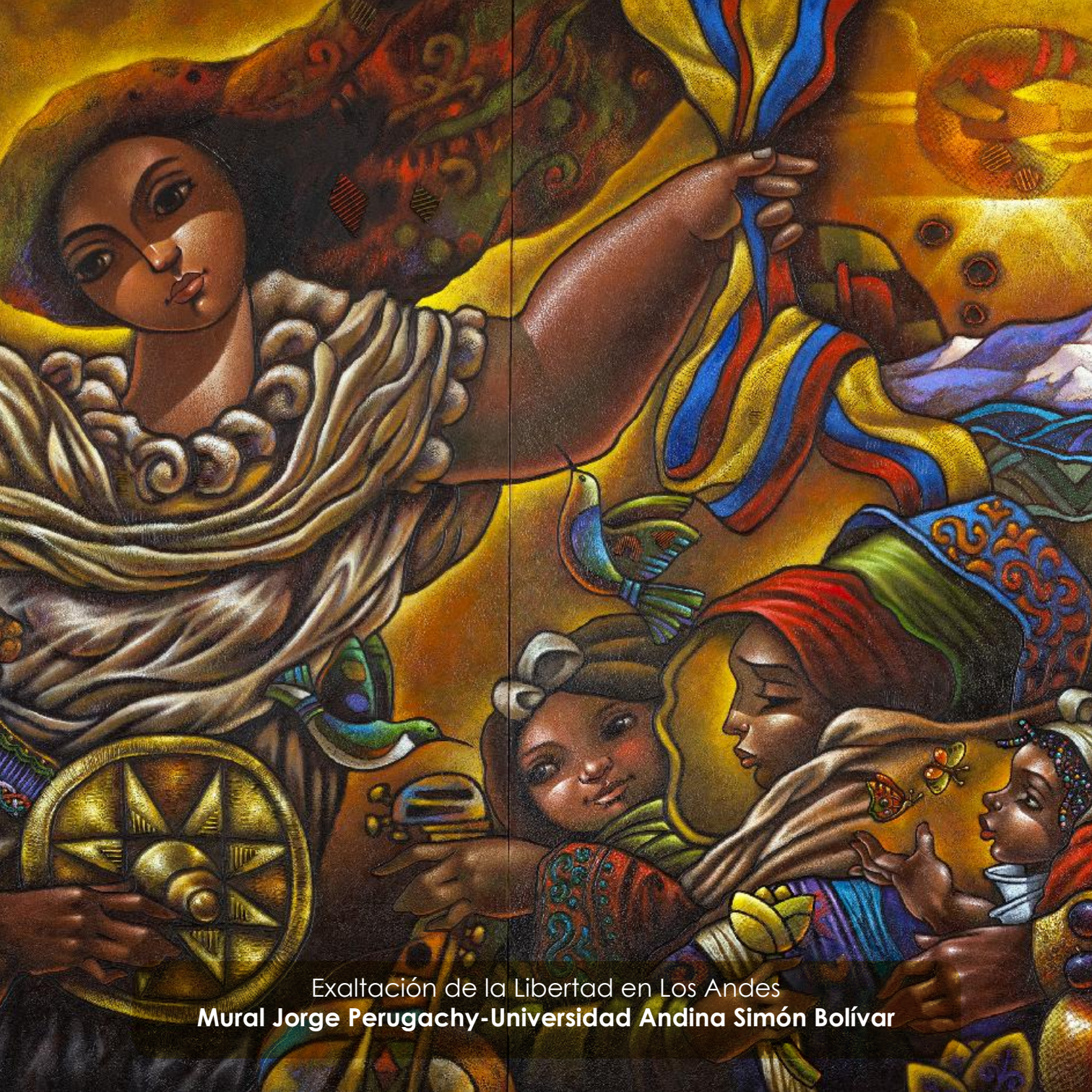
Exaltación de la Libertad en Los Andes Mural Jorge Perugachy-Universidad Andina Simón Bolívar