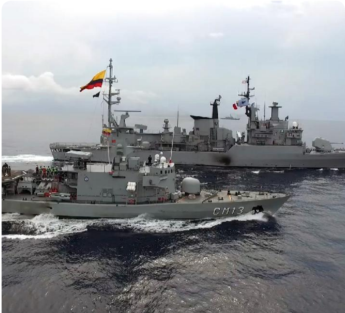
CORBETAS MISILERAS-MANIOBRAS UNITAS