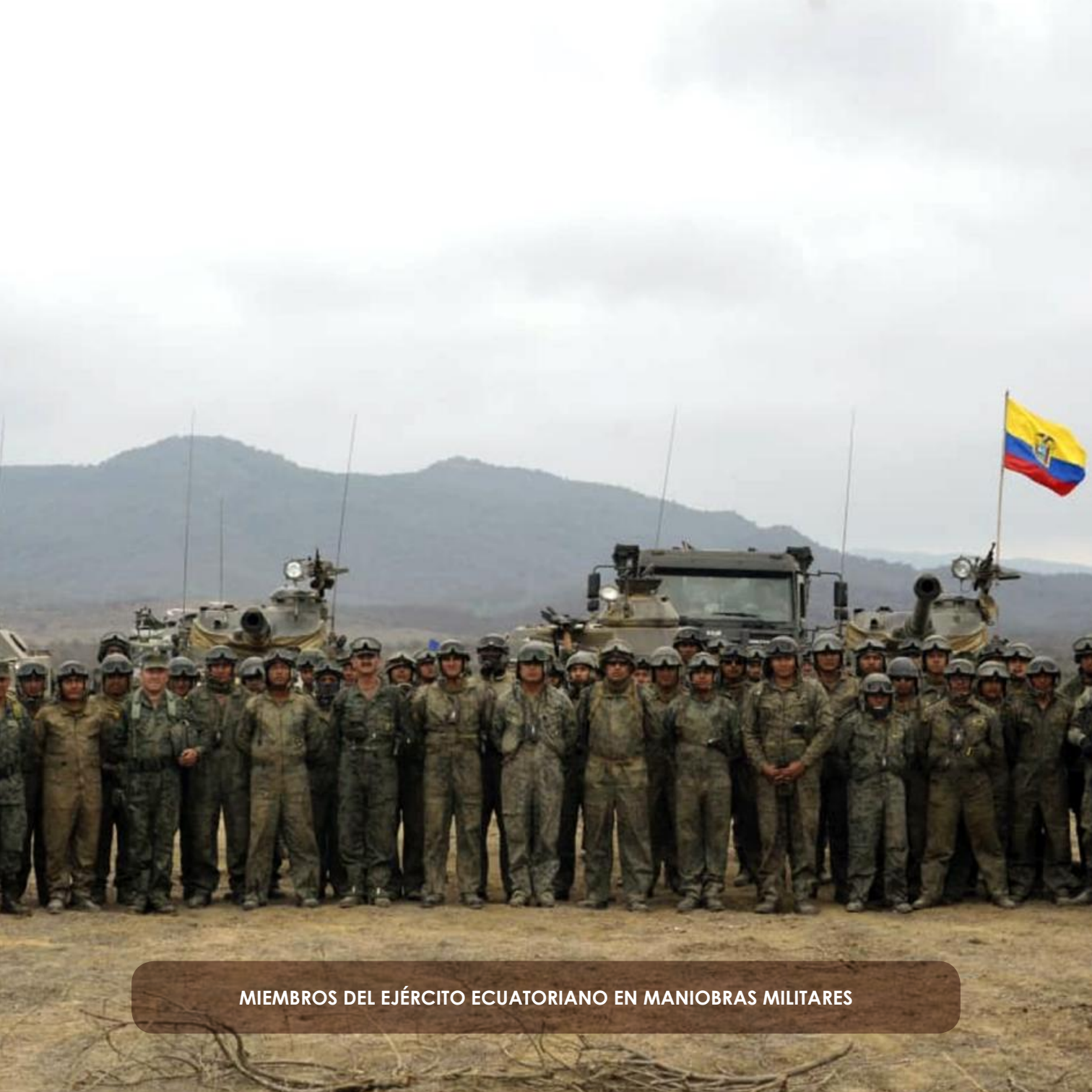
MIEMBROS DEL EJÉRCITO ECUATORIANO EN MANIOBRAS MILITARES