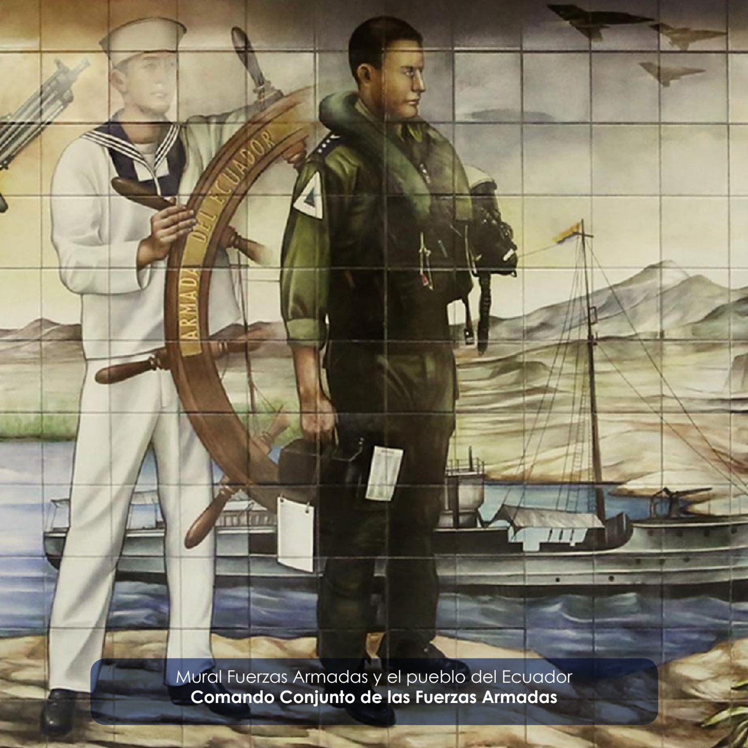
Mural Fuerzas Armadas y el pueblo del Ecuador Comando Conjunto de las Fuerzas Armadas