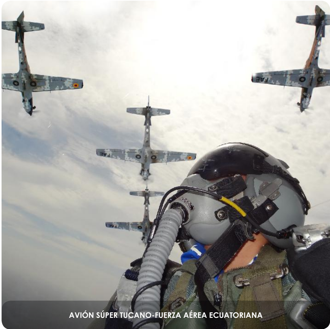
AVIÓN SÚPER TUCANO-FUERZA AÉREA ECUATORIANA