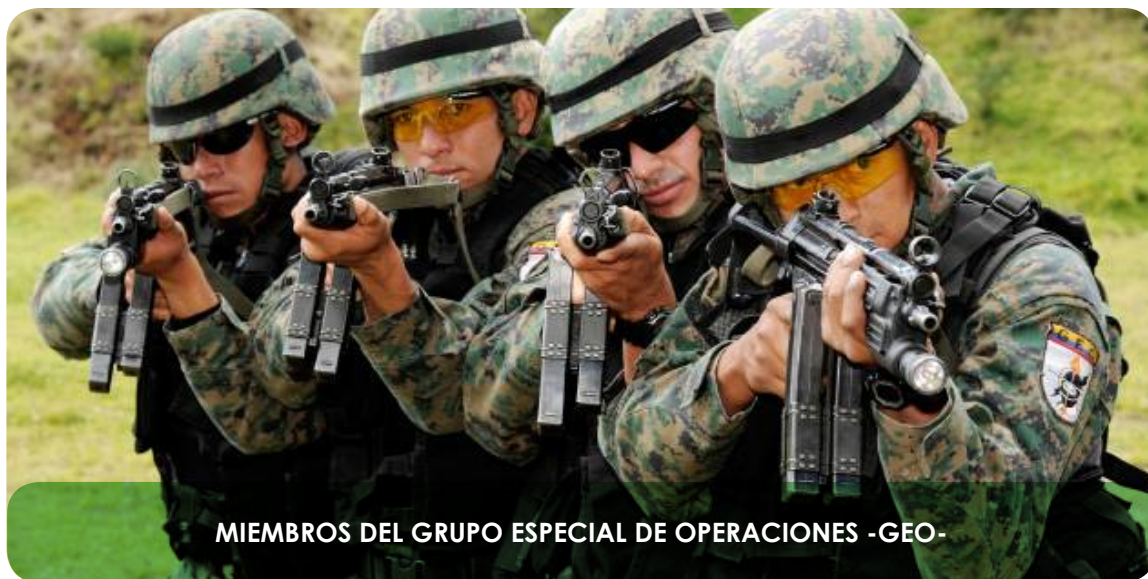
MIEMBROS DEL GRUPO ESPECIAL DE OPERACIONES -GEO-

El Ecuador es un país megadiverso en flora, fauna y recursos naturales, que son estratégicos para el desarrollo nacional, pero son susceptibles a la explotación