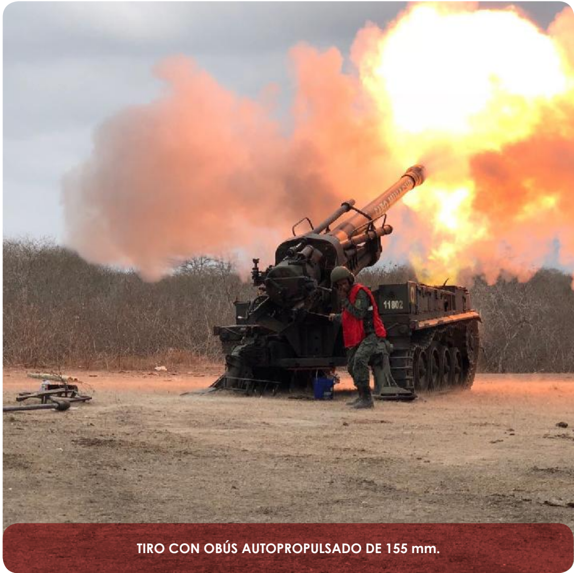
TIRO CON OBÚS AUTOPROPULSADO DE 155 mm.