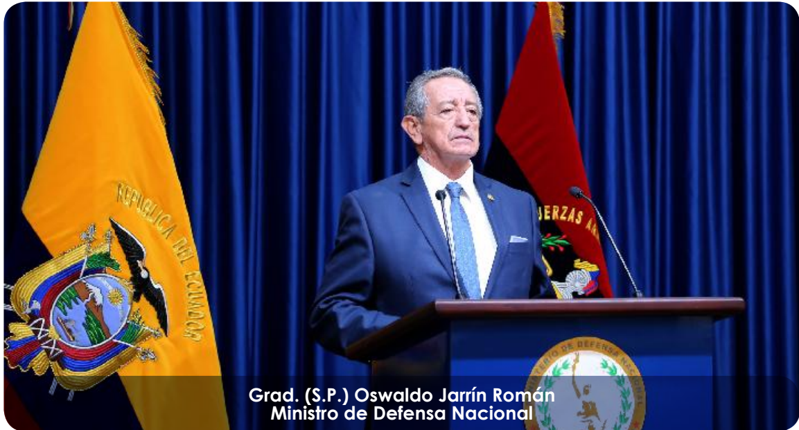
Grad. (S.P.) Oswaldo Jarrín Román Ministro de Defensa Nacional