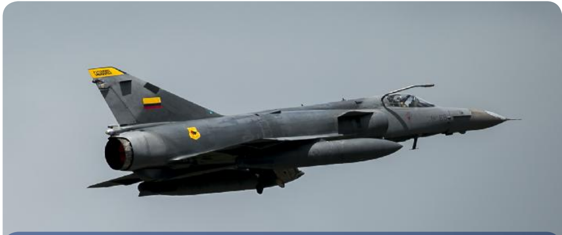
AVIÓN CHEETHA EN DEMOSTRACIÓN AÉREA