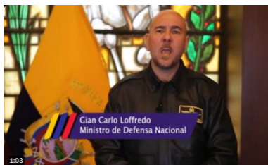
Gian Carlo Loffredo Ministro de Defensa Nacional