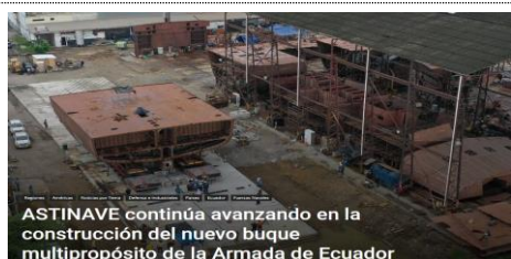
ASTINAVE continúa avanzando en la construcción del nuevo buque multipropósito de la Armada de Ecuador

"La propuesta ha sido acogida muy positivamente; tenemos el propósito de colaborar y quisiera agradecer a la parte ecuatoriana. Vamos a tener un intercambio muy estrecho en materia de seguridad", señaló la ministra del Interior de Alemania, Nancy Faeser, tras su encuentro con su homóloga ecuatoriana, Mónica Palencia. Ver más