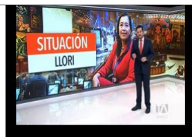
Podría darse un eventual relevo en la presidencia de la asamblea. Teleamazonas. 2-abril-2022