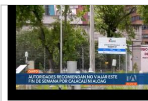
Se registrarán tormentas eléctricas y neblina espesa por Calacali y Alóag. Teleamazonas. 2-abril-2022