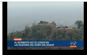
Se descartó que la explosión del radar en Montecristi haya sido por daño interno. Teleamazonas. 2-abril-2022. Ver más.