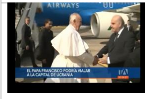
El Papa Francisco podría viajar a la capital de Ucrania. Teleamazonas. 2-abril-2022