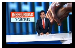
Inseguridad y cárceles. Teleamazonas. 2-abril-2022