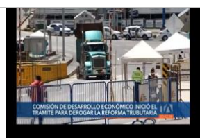
Comisión de desarrollo económico inició el trámite para derogar la reforma tributaria. Teleamazonas. 2-abril-2022