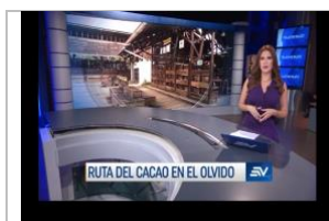
Ruta del cacao en el olvido. Ecuavisa. 2-abril-2022