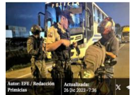
Autor: EFE / Redacción Primicias Actualizado: 26 Dic 2023 - 7:28

Con más de 7.000 cámaras de videovigilancia, el ECU 911 monitoreó las actividades en espacios abiertos, sitios turísticos, parques, vías de acceso peatonal y de vehículos, playas, balnearios y eventos turísticos que se desarrollaron en todo el país. Ver más