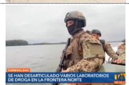
FFAAECUADOR SE HAN DESARTICULADO VARIOS LABORATORIOS DE DROGA EN LA FRONTERA NORTE

FFAAECUADOR a través de la Fuerza de Tarea Conjunta Esmeraldas realizó en 2023, más de 3 000 operaciones antidelictivas en esta provincia. Soldados comprometidos con la Patria, por la seguridad y paz de los ciudadanos. Ver más