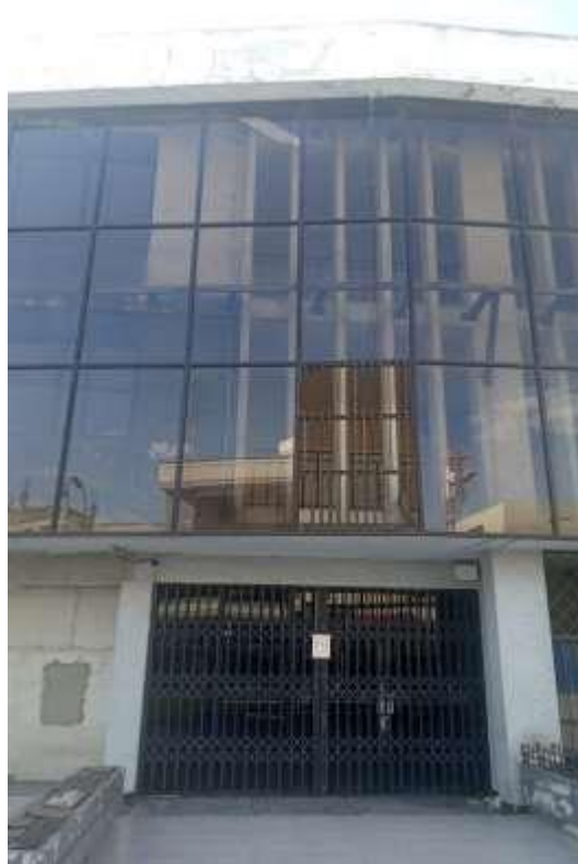
FACHADA DE EDIFICIO